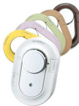
ピオマ 感震ライト付火災警報器(UGS1)